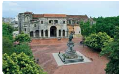
Vista del Parque Colón

Plaza del lado norte de la Catedral rodeada por edificios de arquitectura ecléctica (colonial, republicana y moderna). En 1887 se instaló la estatua de Cristóbal Colón obra del francés Ernesto Guilbert, dándole al parque su nombre actual. Su ambientación por los grandes árboles hacen de ella una sala urbana, lugar preferido de los capitalinos por sus cafés al aire libre, tertulias y peñas.