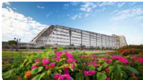
Faro a Colón

Colosal mausoleo dedicado a Cristóbal Colón de 210 metros de largo por 59 de alto. El arquitecto escocés J.L. Gleaves fue el ganador del concurso internacional de diseño organizado en 1929, empero la obra no se realizaría hasta 1992 para conmemorar los 500