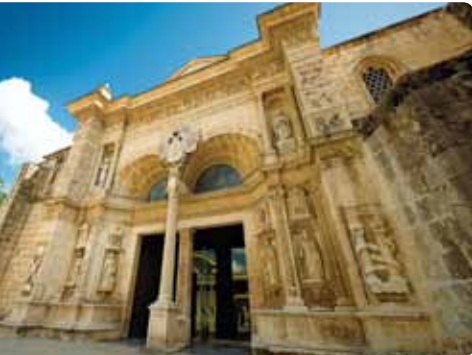
Catedral Primada de América

Es la más antigua de las Américas. La inició Alonso Rodríguez en 1514, el arquitecto que