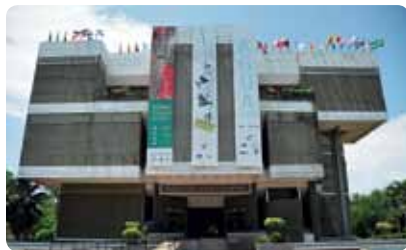
Museo de Arte Moderno

Cuatro pisos dedicados al arte contemporáneo del siglo XX, con exposiciones temporales todo el año. Cada dos años se celebra la Bienal de las Artes Visuales. También es centro de charlas, cursos y presentación de videos sobre arte. Mar-Dom 9am-5pm. Cerrado los lunes. Av. Pedro Henríquez Ureña, 809 685-2153.