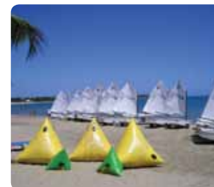
Club Náutico Santo Domingo