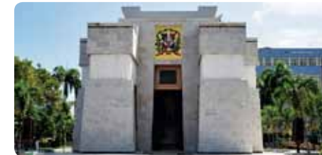
Altar de la Patria, Parque Independencia

El mausoleo en mármol de Carrara que ocupa el centro del Parque es la sepultura de los restos de los padres de la Patria -- Juan Pablo Duarte, Matías Ramón Mella y Francisco del Rosario Sánchez. El compás en su centro marca el kilómetro cero desde donde se cuentan todas las distancias de las carreteras que parten de la ciudad hacia el interior de la República. La verja perimetral es la galería de exposiciones al aire libre más extensa de la ciudad. Palo Hincado esq. Independencia.