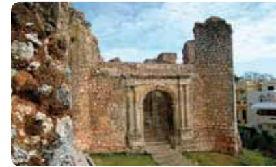
Ruinas de San Francisco

Bellísimo ejemplo de portal renacentista español (estilo plateresco) con el cordón de la orden de San Francisco esculpido en piedra. Este fue el primer monasterio de América. Cuenta la leyenda que en el se educó el Cacique Enriquillo, primer jefe rebelde nativo de América con el que la corona española firmó un tratado de paz. Hostos entre Emiliano Tejera & Restauración, 809 686-8657.