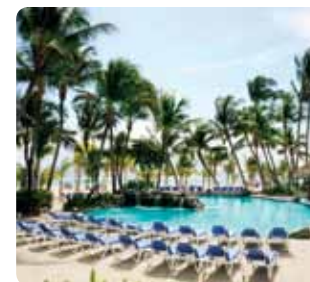
Resort de playa