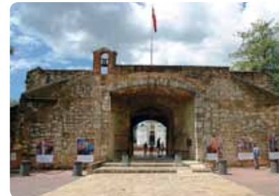
Puerta del Conde