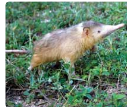
Mamífero más antiguo, el Solenodonte de la Hispaniola

El Zoológico realiza importante labor de concientización de especies en vías de extinción, con importantes trabajos con el solenodonte, el cocodrilo Americano, iguana rinoceronte, jicoteas, y el gavián de la Hispaniola entre otros. Mar-Dom 9am-5pm. Av. Los Arroyos de Arroyo Hondo, 809 562-3149