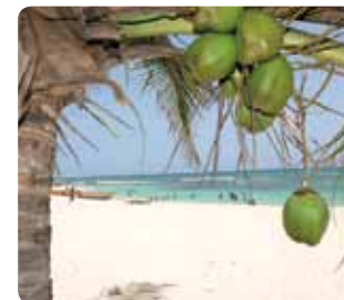
Playa Juan Dolio

3 kms al este de Guayacanes. Altas torres residenciales vendidas a residentes en la capital divisan el mar, y cercana a grandes desarrollos residenciales de golf. Buenos restaurantes. La angosta franja de playa anima a un día de descanso en la playa.