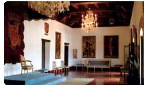
Interior del Museo de las Casas Reales

Actualmente mantiene una exhibición de la historia dominicana de 1492-1821. Este fue el centro de gobierno y administración de la