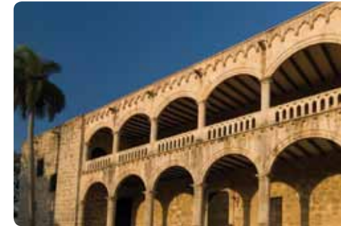
Alcázar de Colón

Construido entre 1510 y 1512 por Diego Colón, nombrado Virrey de Indias por la Casa Real Española. Junto a su esposa María de Toledo rigieron allí la primera corte virreinal de América. Por este palacio desfilaron grandes figuras de la conquista de América como Hernán Cortés, Francisco Pizarro, Ponce de León. Fue restaurado en el 1955 como museo donde se exhiben más de 800 piezas originales de uso doméstico de los siglos XIII al