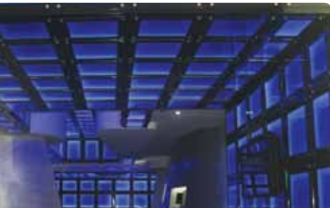
Centro Cultural de las Telecomunicaciones

Amplia exhibición de la historia de la radio, televisión y telecomunicaciones en la República Dominicana.