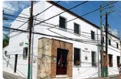
Museo del Ambar

Exhibición de muestras de ámbar, resina fósil que a través de los siglos ha sido muy apreciada como una joya. Se muestra la forma de extracción en las minas, el tallado y piezas con insectos, hojas e incluso lagartos prehistóricos conservados primorosamente en su interior. Lun-Sab 8:30am-6pm, Dom 9am-1pm. Arzobispo Meriño esq. Restauración, 809 682-3309.