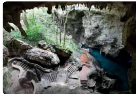
Los Tres Ojos

Toda la fauna del Mar Caribe en un sólo lugar y tan cerca que casi podría tocarse. A través de un túnel de plexiglas se camina por una galería de observación de tiburones, mantarrrayas, tortugas, y los coloridos peces tropicales. A corta distancia del Faro a Colón. Mar-Dom 9:30am-5:30pm. Cerrado los lunes. Av. España 77, 809 766-1709.