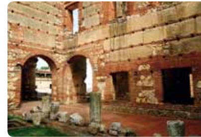
Hospital San Nicolás de Bari

Ruinas del primer hospital del Nuevo Mundo, construido en 1503 por orden de Ovando, que dedicó la renta de varias de sus casas para su mantenimiento con la finalidad de que prestara auxilio a todos los pobres que pudiese albergar. Hostos esq. General Luperón.